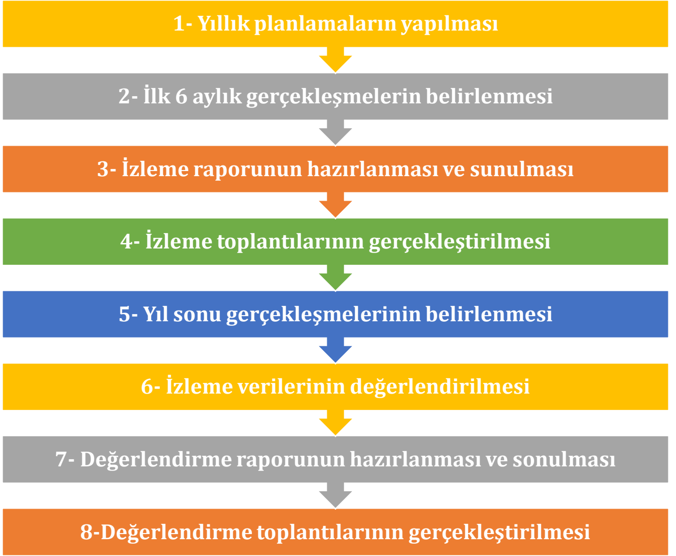
Şekil 2 İzleme ve Değerlendirme Süreci